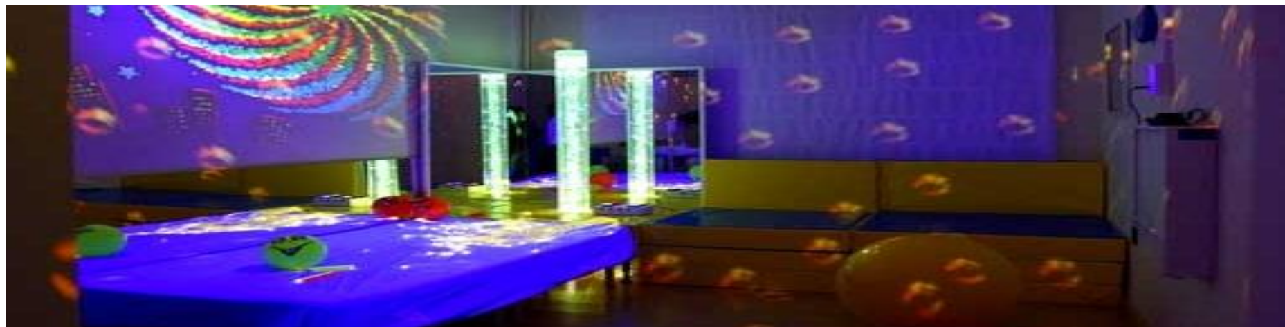
Sala de estimulación sensorial